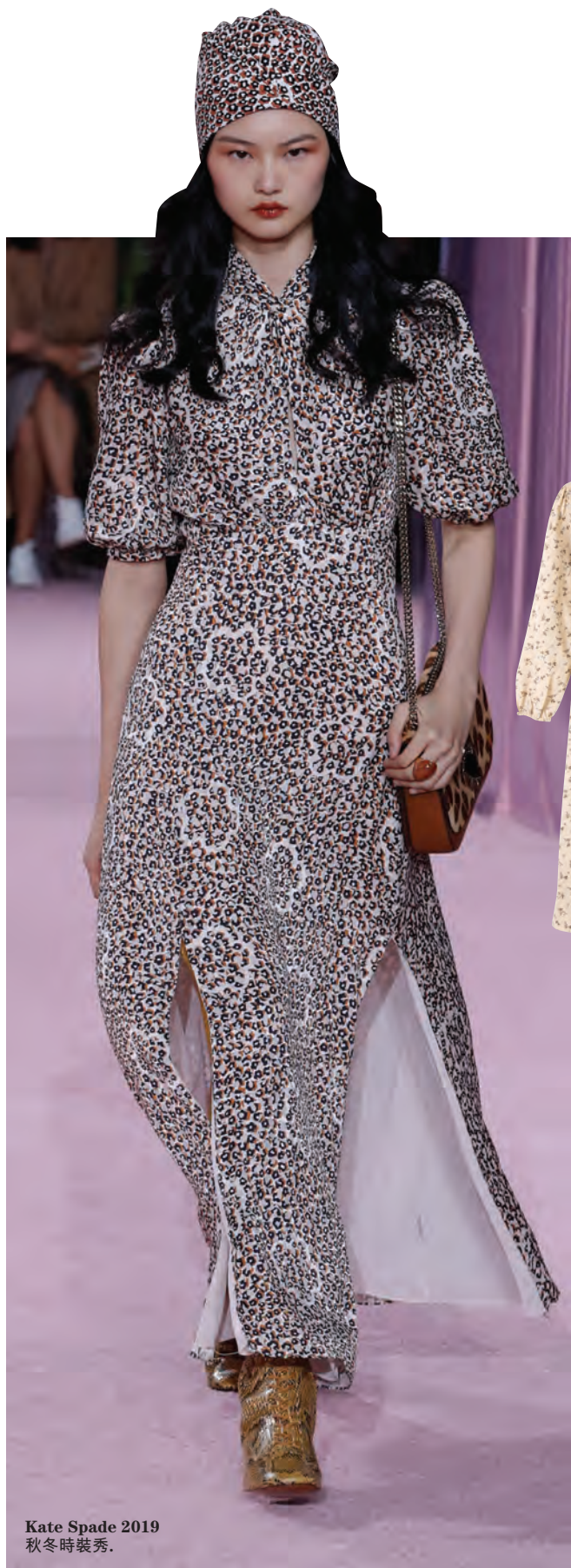
Kate Spade 2019 秋冬時裝秀。