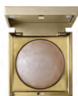
STILA HEAVEN'S HUE HIGH-