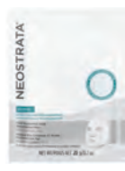
NEOSTRATA PURE HYALURONIC ACID BLEMISH GEL