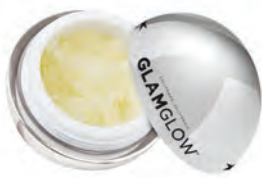
GLAMGLOW POUTMUD FIZZY LIP EXFOLIATING TREATMENT, $30