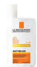
LA ROCHE POSAY ANTHELIOS ULTRA