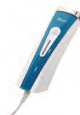
SILK'N BLUE ACNE ELIMINATOR