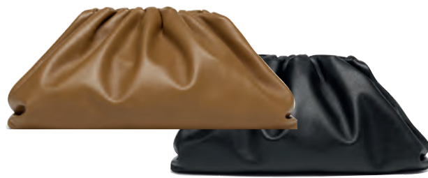
BOTTEGA VENETA POUCH, $3,266, BOTTEGAVENETA.COM